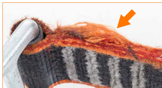
Nauhalenkki, jonka reunat ovat erittäin kuluneet.