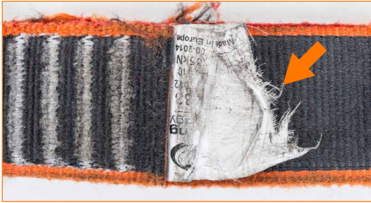
Repeytymisen takia lukukelvoton tunnistetietolappu.