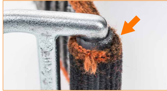
Nauhalenkki, joka on vaurioitunut kohdasta, jossa se on kosketuksissa metallirenkaan kanssa.